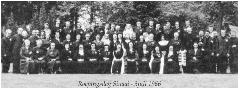
Roepingsdag Sinaai - 3juli 1966