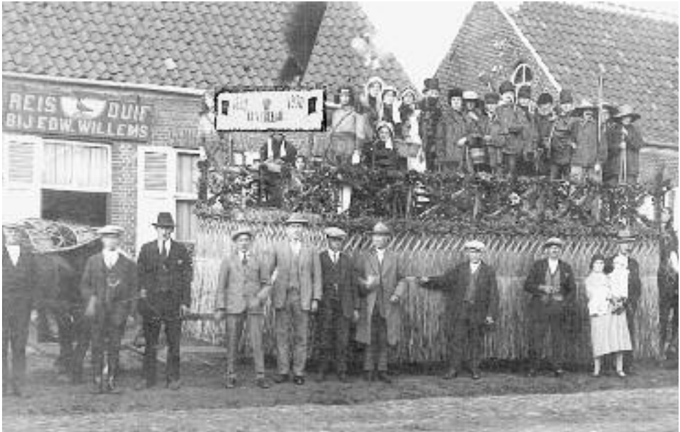
1930 Eeuwfeest - Praalwagen van de Steenenmuur Het werk op de oude hoeve