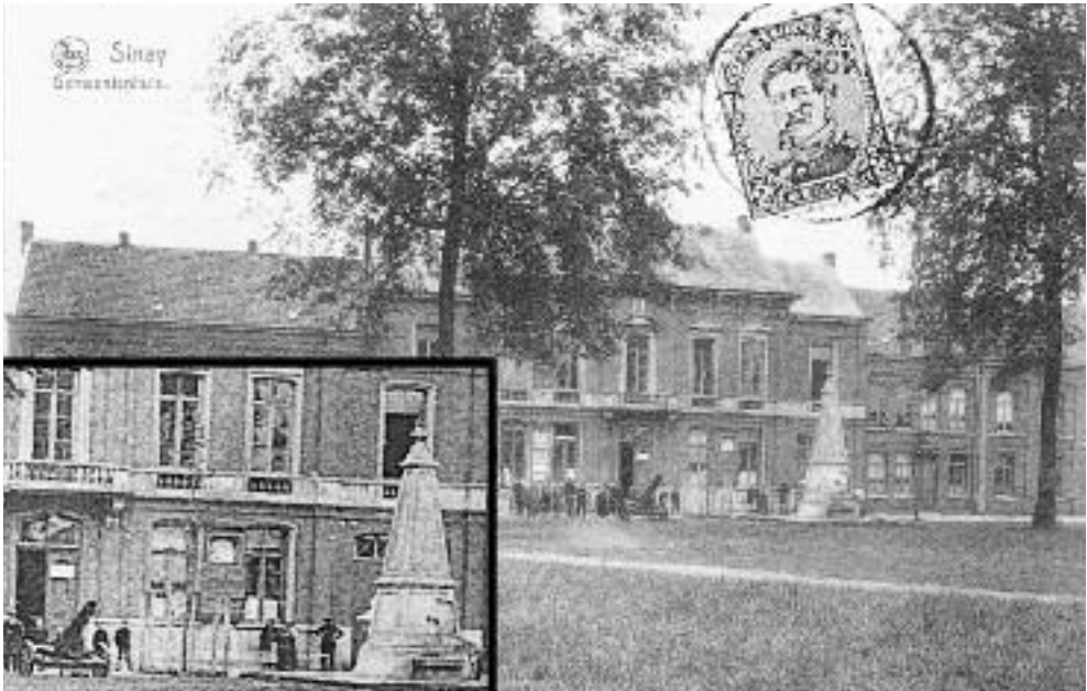
Tussen pomp en kanon, recht tegenover de ingangsdeur van het gemeentehuis, werd op 5 mei 1920 een vrijheidsboom geplant. Op de foto uit 1922: het nog jonge boompje ter bescherming tussen 4 palen.