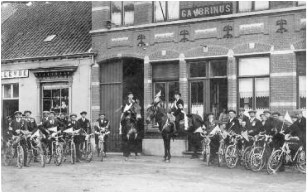
1930 Eeuwfeest - Veloclub De lustige Wielrijders