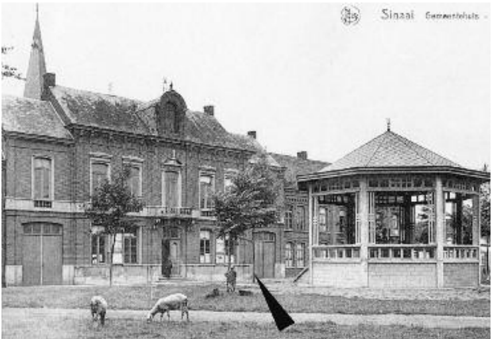
Tussen kiosk en het gemeentehuis de vrijheidsboom (met pijl aangeduid). Eind 1930 werd de vrijheidsboom, bij nacht, door onbekenden afgezaagd.