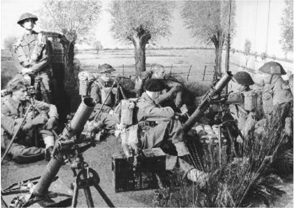
Soldaten van de 1 e Pantserdivisie van generaal Stanislaw Maczek in het Canada Poland War Museum.