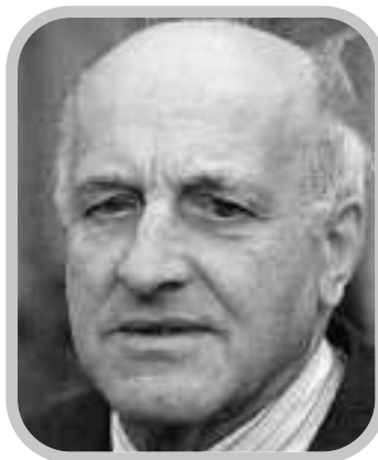
Anton van Wilderode