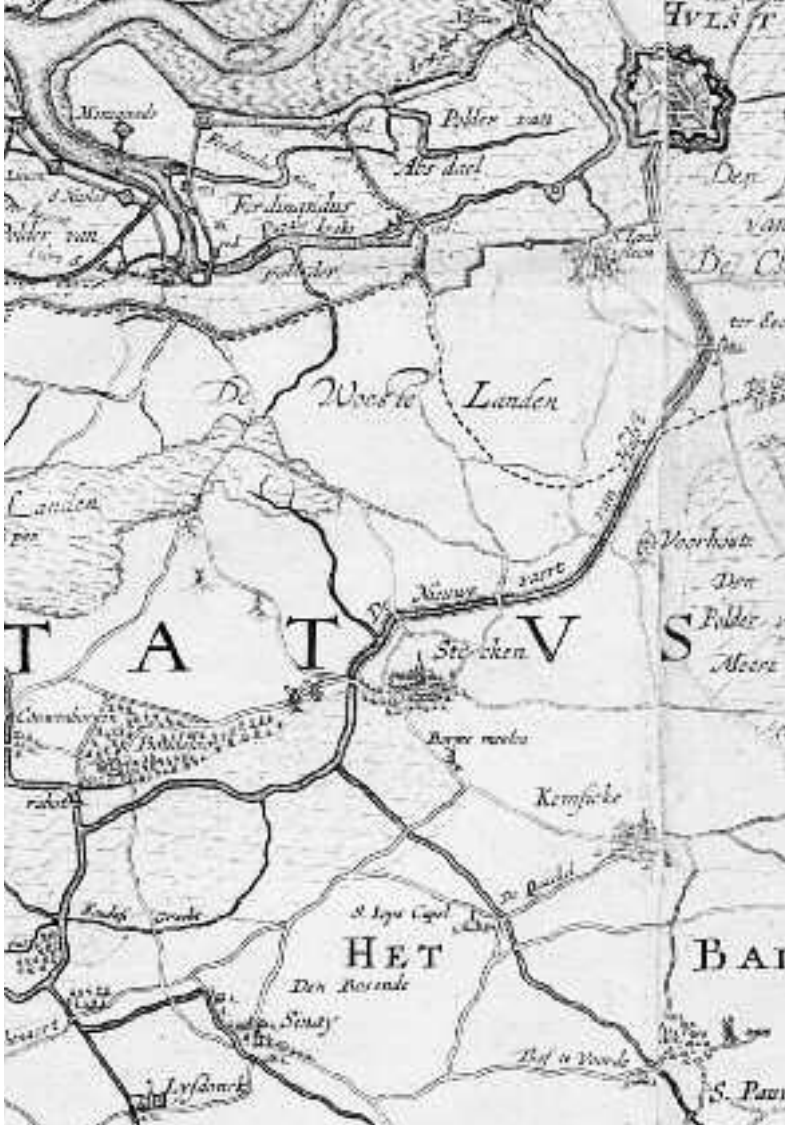
De nieuwe vaert (Stekense vaert) 1656

Tijdschrift van Heemkring "Den Dissel" Sinaai jaargang 11 nr. 4 - 2015