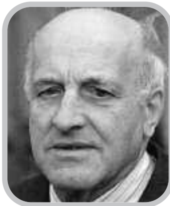
Anton van Wilderode