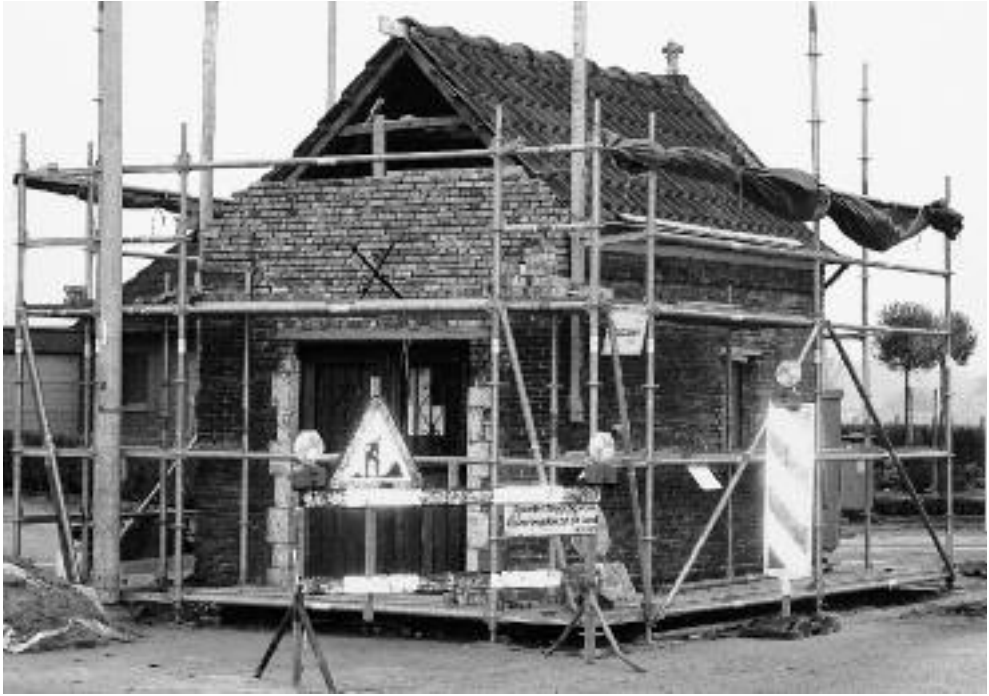
De kapel tijdens de restauratiewerken in 2008