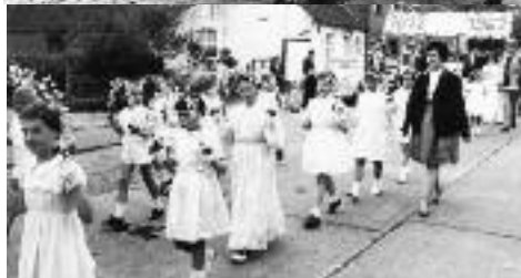
In 1962 werd het 150-jarig bestaan van de Sint-Annakapel gevierd met een prachtige stoet op de wijk Stenenmuur.