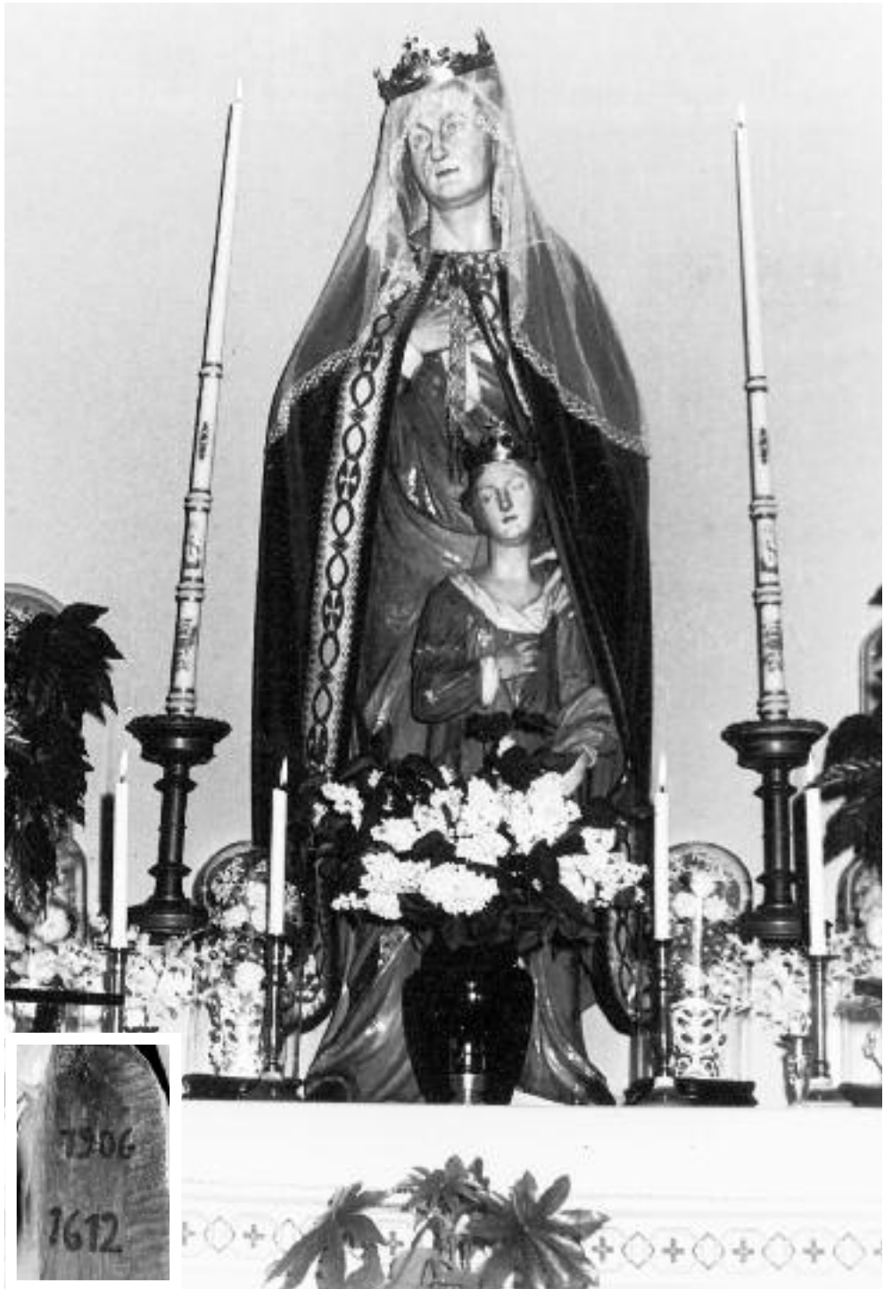
Het oude Sint-Anna beeld, dat vroeger in de kapel stond, vinden we nu terug in de kerk.