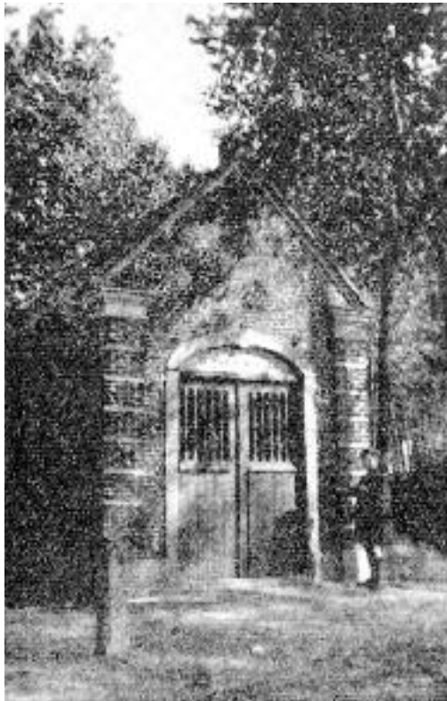
De kapel in 1937