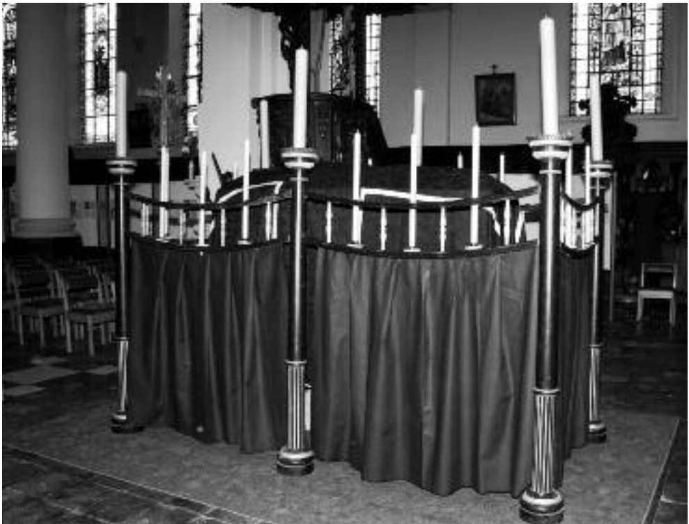
De katafalk tijdens de nacht van de geschiedenis in maart 2010.