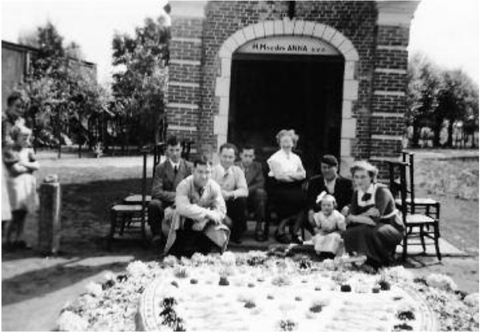
15 augustus 1954: In de jaren '50 legde men jaarlijks een zandtapijt voor de kapel.