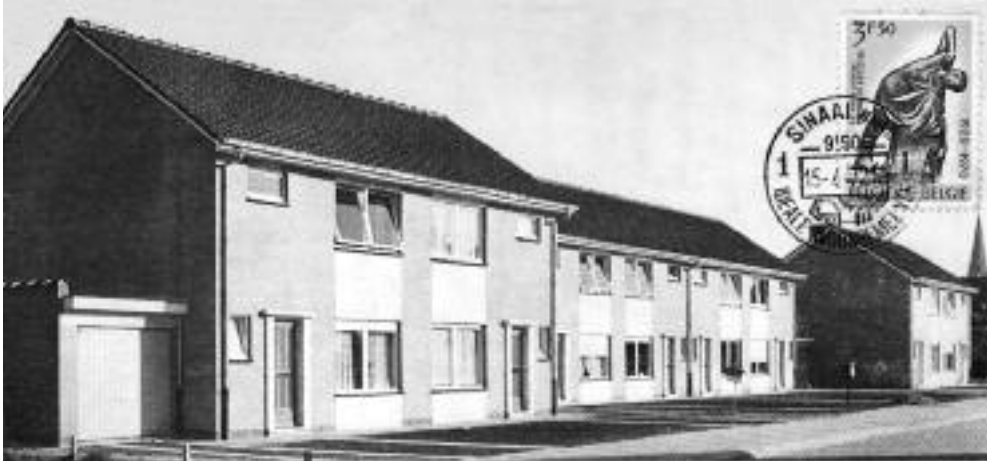
Dans poststempel werd voor het eerst in gebruik genomen te Stad: op 15 april 1972, ter gelegenheid van de investing van de eerste 25 woningen van de Papenackerwijk, gebouwd door de Sint-Niklase Maatschappij voor de Huisvesting. Van deze kunnen werden er kortstondig gedrukt.

In het najaar van 1971 waren de eerste huizen in de Papenackerwijk (Klokke Roelandlaan) afgewerkt en bewoond. Op een oppervlakte van 1,4 ha bouwde de Sint-Niklase Maatschappij voor Huisvesting 25 woningen onder het stelsel belofte van aankoop.