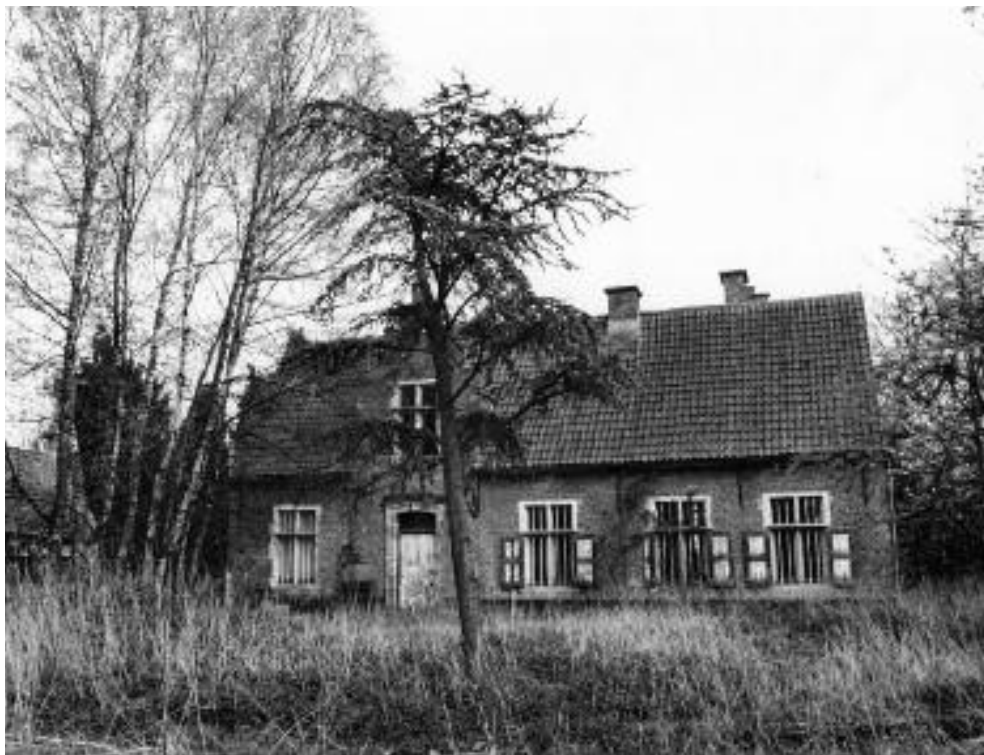
De Lysdonckhoeve omstreeks 1968.