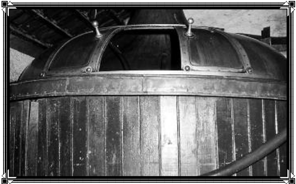
Roerkuip Brouwerij Capoen

Tijdschrift van Heemkring "Den Dissel" Sinaai