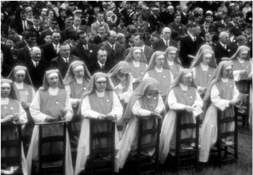
De zusters Reparatrices "De Blauwkes" die voor het eerst in groep naar buiten kwamen.