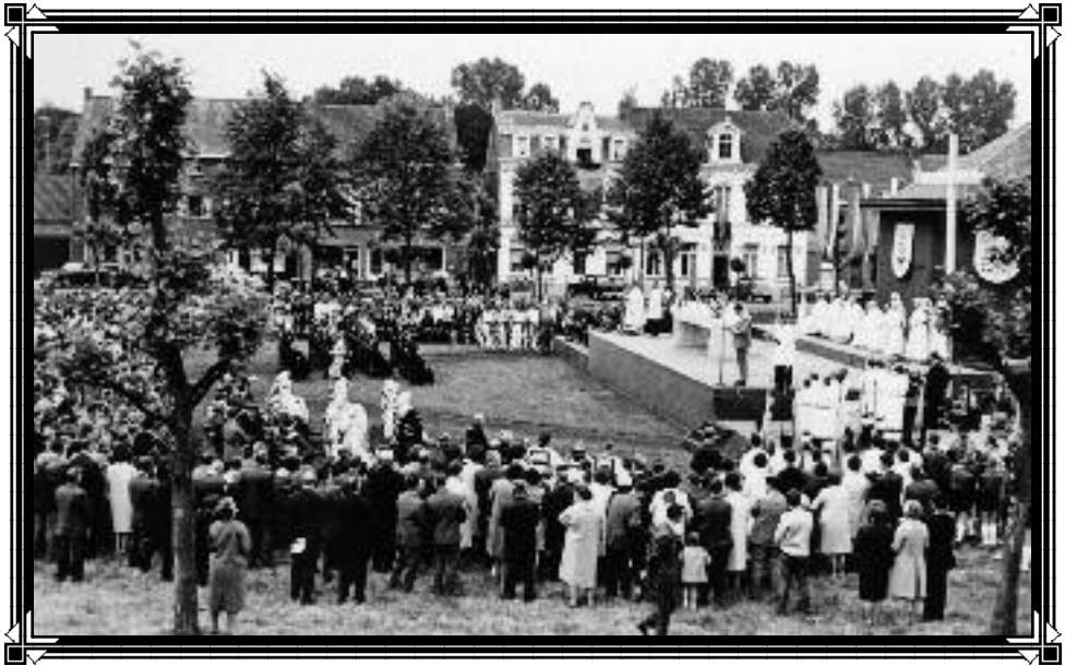
Algemeen beeld van de viering 750 jaar Sinaai

Tijdschrift van Heemkring "Den Dissel" Sinaai