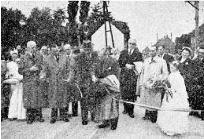
In de krant werd er aandacht besteed aan de feestelijkheden

Op zondag 31 mei 1953 mocht Sinaai met reden feesten. De nieuwe baan van Lokeren tot Puivelde werd plechtig ingehuldigd. Een stoet met schoolkinderen, gemeenteoverheden, genodigden en de plaatselijke harmonie hield halt aan het begin van de Hulstbaan waar bestendig afgevaardigde d'Hanens het lint doorknipte. Hetzelfde vond plaats in de Vleeshouwersstraat. Schietingen, een wielervedstrijd en een volksbal 's avonds maakten van deze dag een heuglijk feest.