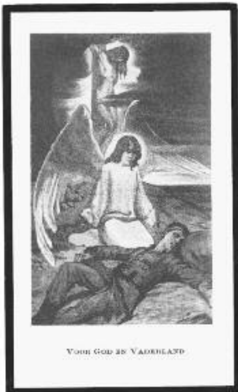
VOOR GOD EN VADERLAND