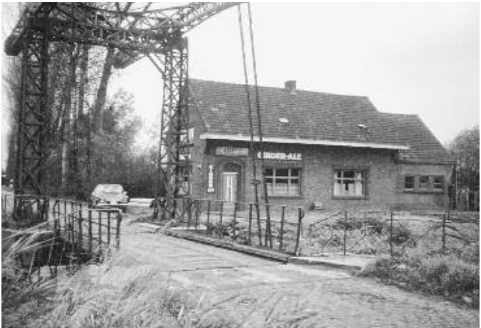
De oude "Koebrug" omstreeks 1970