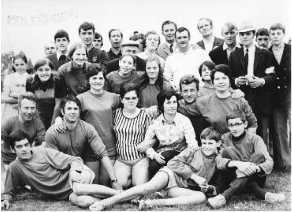
1970 - De winnende ploeg van de Molenhoek