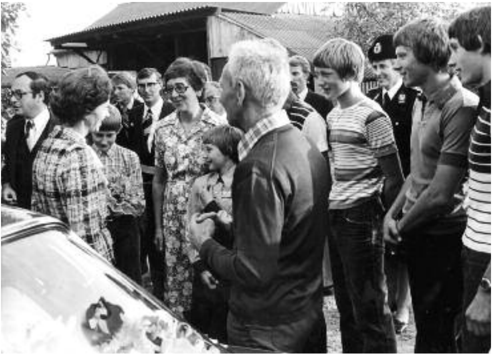
↑ Koningin Fabiola tijdens haar bezoek aan de boerderij.