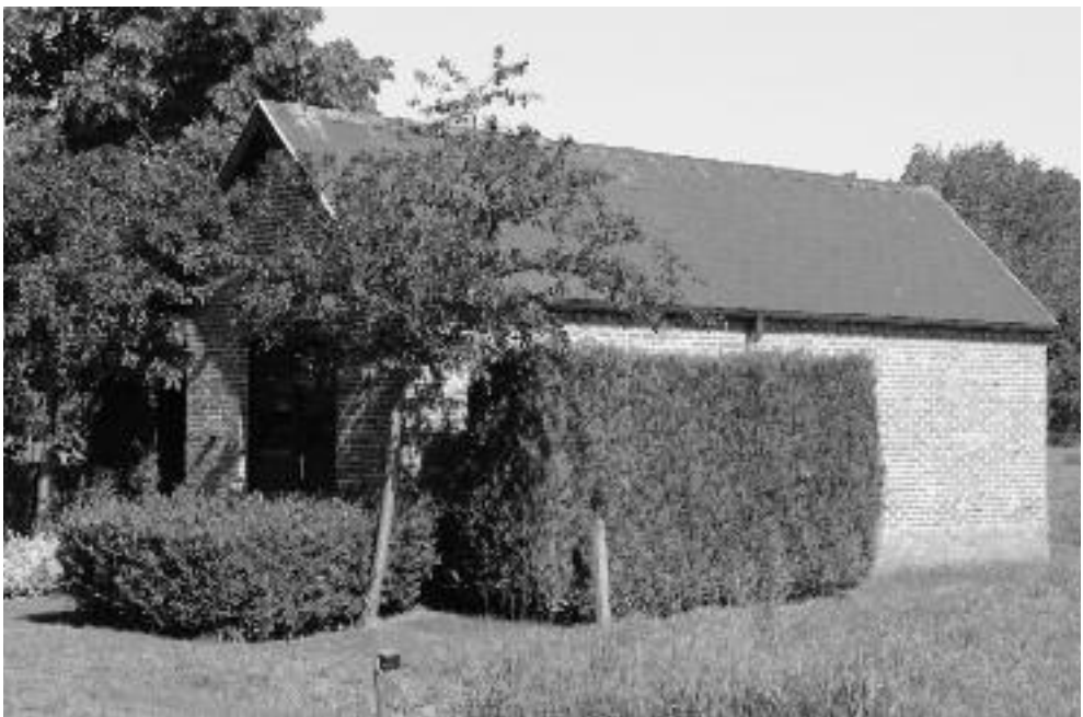
De kapel anno 2011 met in het laatste gedeelte een elektriciteitscabine.

Bij het uur van uw kruisdood hebt Gij, Heer Jezus, geweld dat wij, met U, kinderen werden van de Maagd Maria. Wij bidden U dat zij door haar onverwoestbaar geloof, haar onophoudend gebed en haar moederlijke zorg, ons geleide op Uw weg, tot de glorie van de verrijzenis, van nu af tot in de eeuwen der eeuwen. Amen.