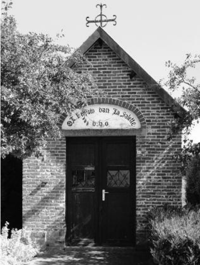
De kapel van O. L.-Vrouw van La Salette

Tijdschrift van Heemkring "Den Dissel" Sinaai jaargang 7 nr. 3 - 2011