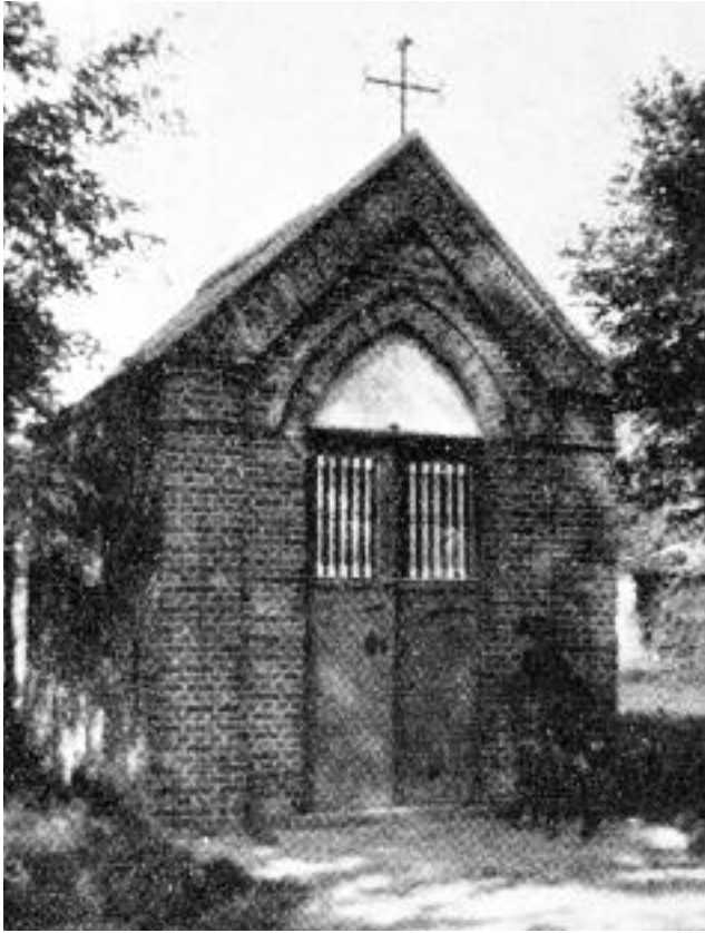
De kapel in 1937

In de annalen van de Koninklijke Oudheidkundige Kring van het Land van Waas (1937, Deel 49, blz 36) vinden we volgende bijdrage: