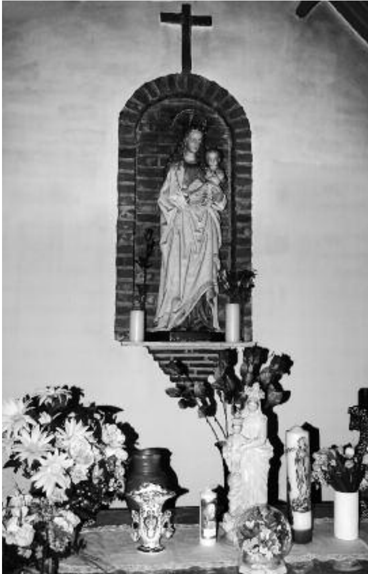
Onze-Lieve-Vrouw van La Salette