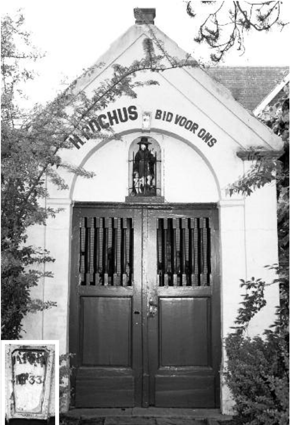
xx33, de 33 is nog duidelijk leesbaar; wellicht verwijst dit naar de oprichtingsdatum van de nieuwe kapel (1833), eerder dan naar de oude kapel.