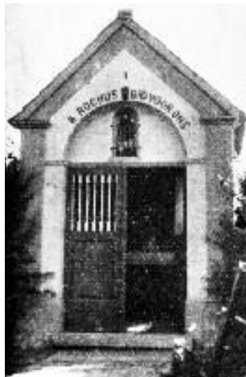
De kapel in 1937