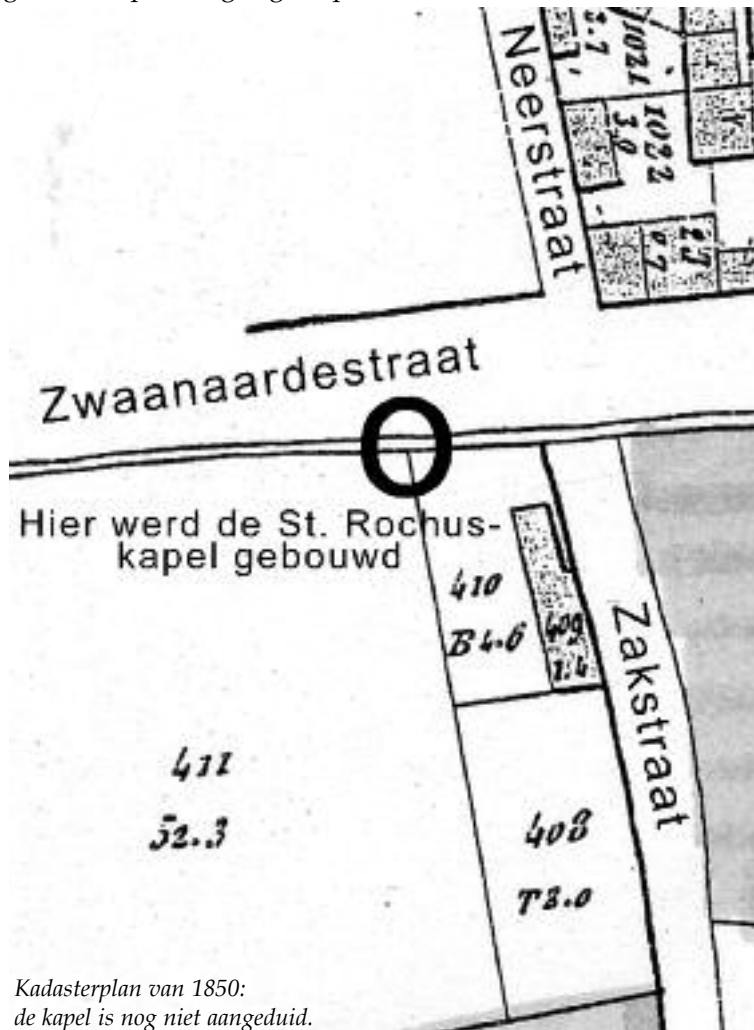
Kadasterplan van 1850: de kapel is nog niet aangeduid.

Intussen werd het eigendomsvraagstuk opgelost: het kapelletje en grond werden toegevoegd aan het perceel gelegen op de hoek van Zakstraat en Zwaanaardestraat.