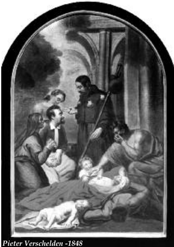
Pieter Verschelden -1848

Sint-Rochus is zonder twijfel één der meest vereerde heiligen in Vlaanderen, maar over zijn leven is niet zo heel veel met zekerheid gekend. Alle kennis baseert zich