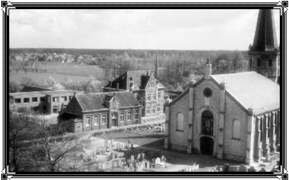
De kerk en pastorie in 1971

Tijdschrift van Heemkring "Den Dissel" Sinaai