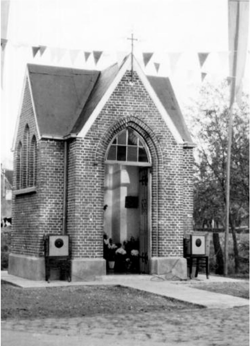
De kapel op de hoek van de Puiveldestraat en de Ransbeekstraat, toegewijd aan O.- L. -Vrouw van Zeven Smarten, na de restauratie.