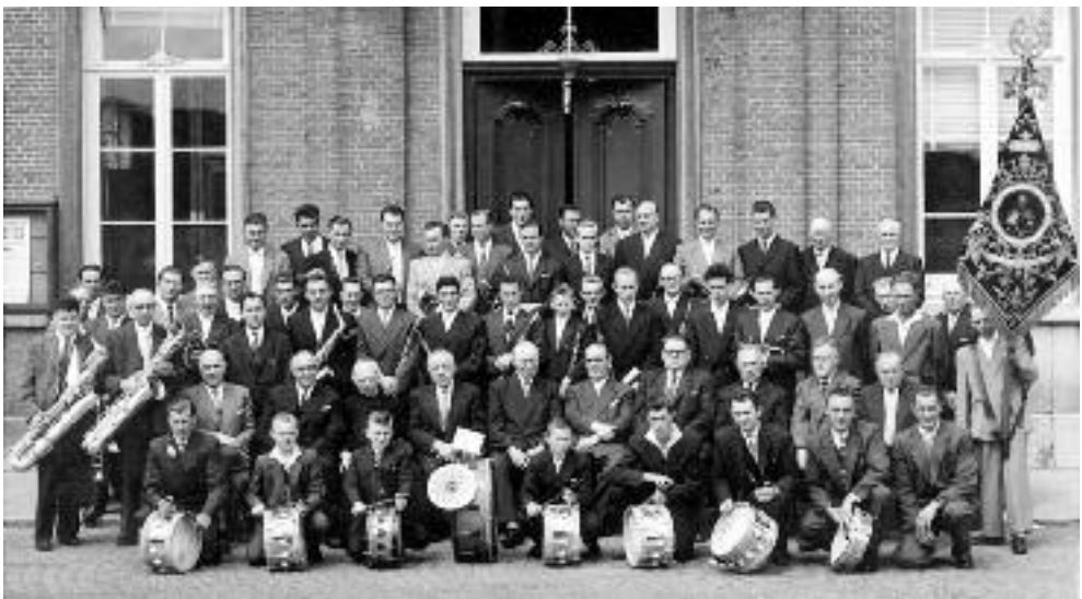
De feestvierende leden van de Koninklijke Harmonie Sint-Cecilia in 1959

Op zondag 17 juni vierde de Koninklijke Harmonie Sint-Cecilia haar 150-jarig bestaan. In de namiddag trok een optocht met deelname van zes muziekkorpsen door de bijzonderste straten van de gemeente. Deze feestelijke dag werd afgesloten met twee muziekconcerten.