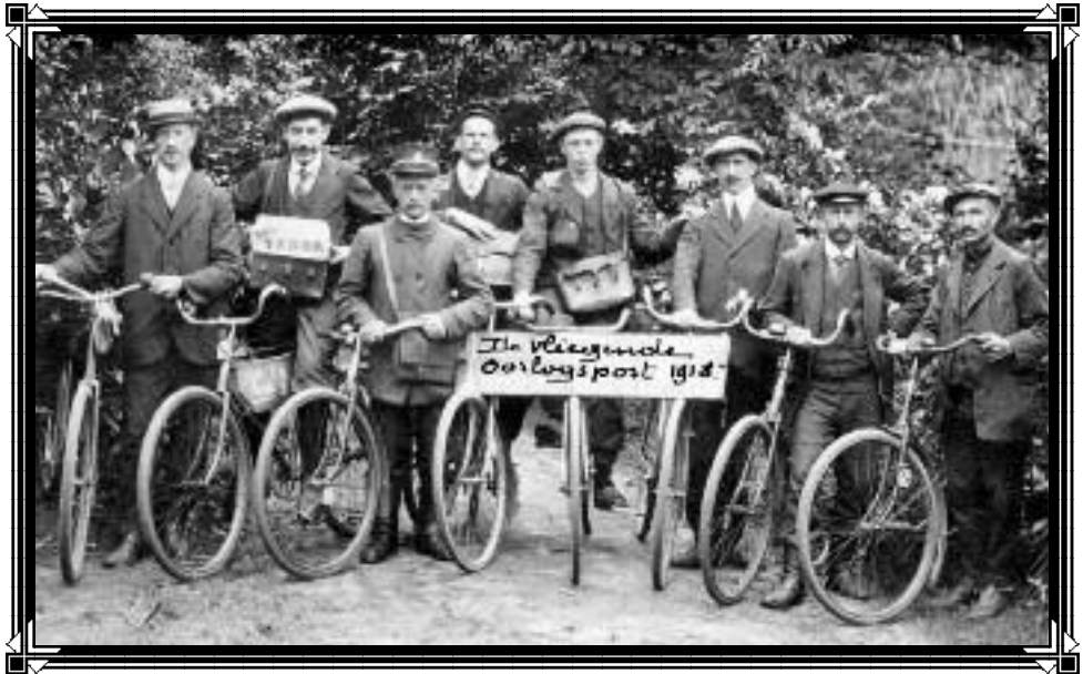
De vliegende oorlogspost - 1918

Tijdschrift van Heemkring "Den Dissel" Sinaai