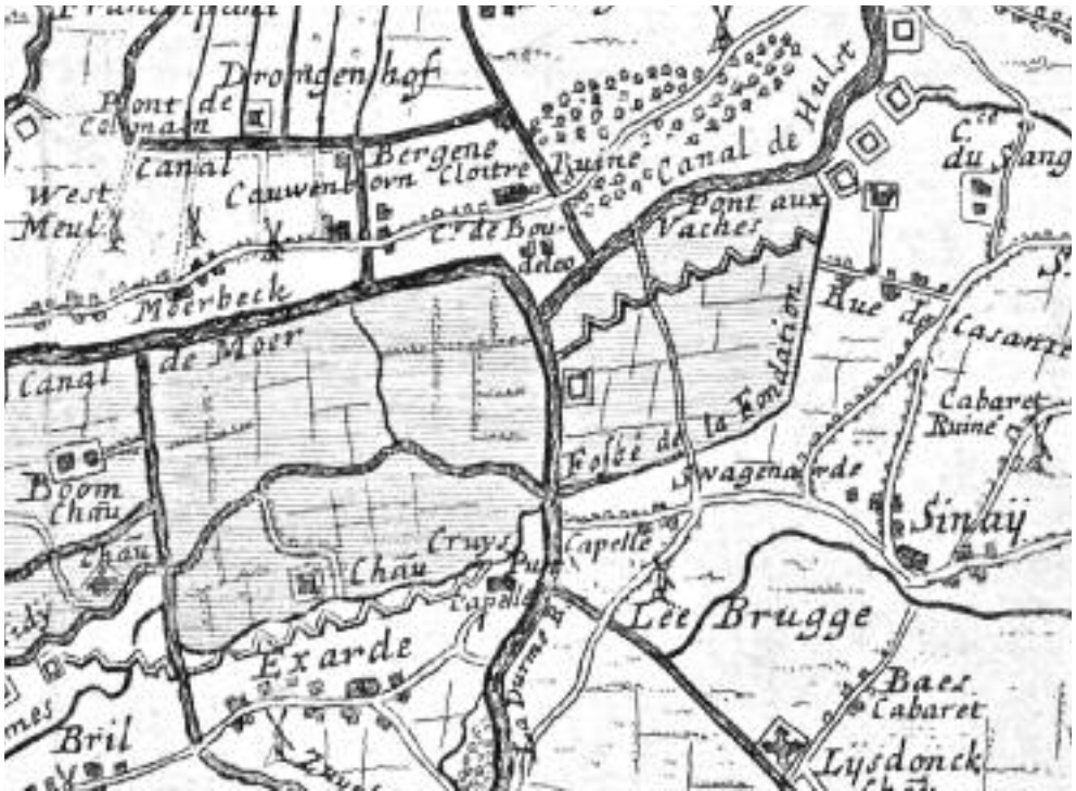
De kaart van "Fricx" uitgave 1712, met de vermelding "Pont aux Vaches".