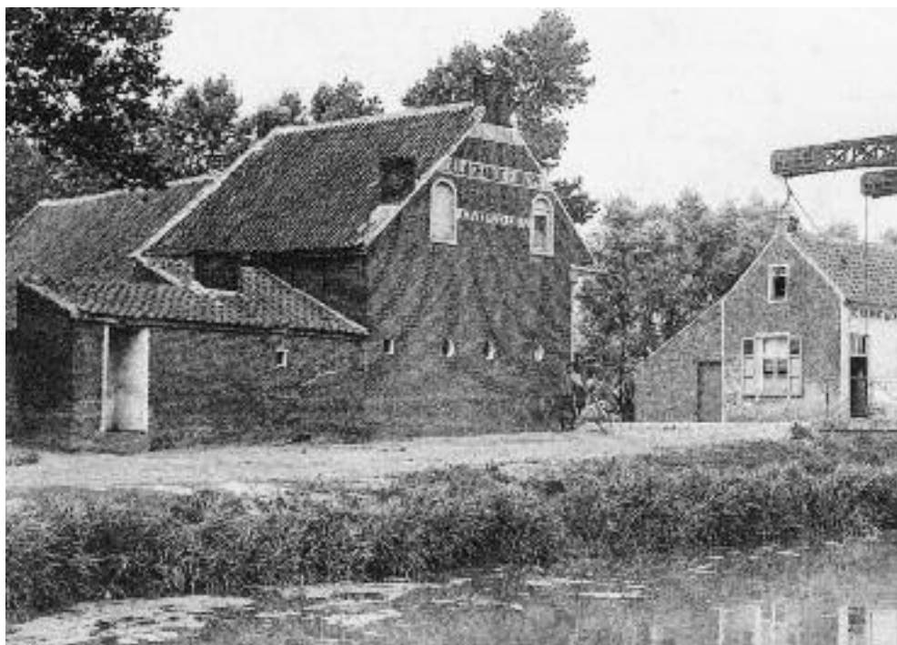
Hotel de la Grande Europe - Civitta Vecchia