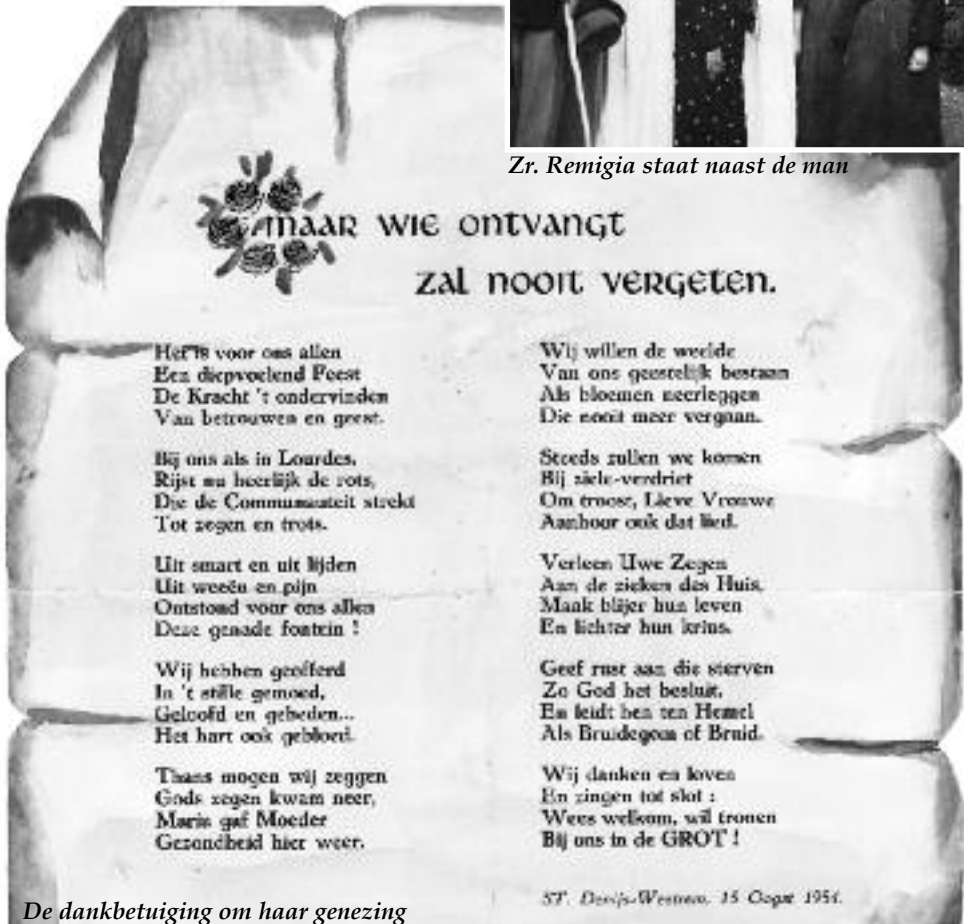
De dankbetuiging om haar genezing