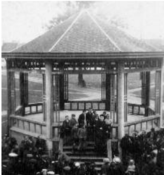
De kiosk in 1943

De firma Scheerders - Van Kerckhove (SVK) bouwde de achthoekige zware betonnen constructie. Hiervoor leende de muziekmaatschappij 40 000 fr, die daarna met gemeentesubsidies en andere financiële steun werden afbetaald. Door deze ingreep is het gemeentehuis van op de Dries beter zichtbaar.