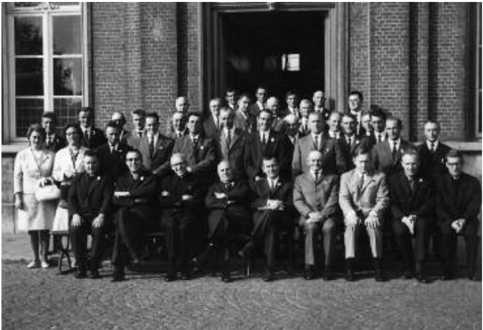
Uitreiking van de oorkonden aan de eigenaars van de Sinaaise hoeven.