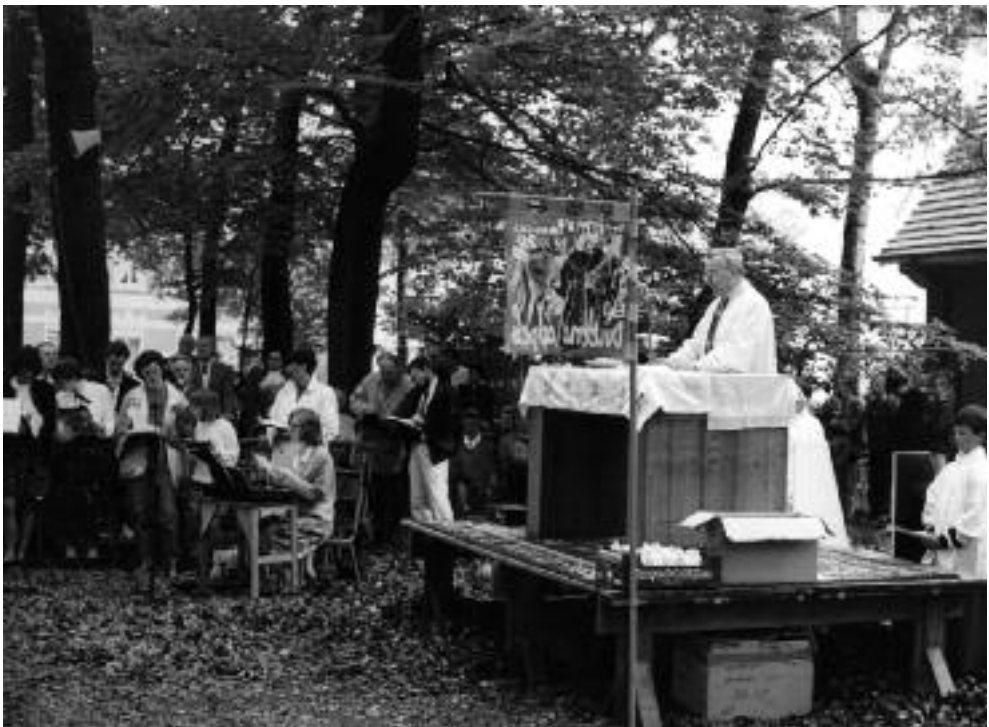
1993 - Eredienst in het Patersbos.