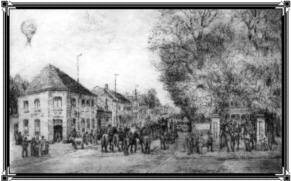
Paardenzegening te Sinaai (ets van Romain Malfliet)

Tijdschrift van Heemkring "Den Dissel" Sinaai