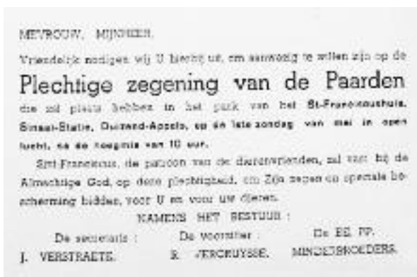
1957 - De eerste uitnodiging voor de paardenzegening.

Dit jaar heeft de tweënvijftigste Ruiterbedevaart plaats, omdat het in de jaren negentig één jaar verboden was om met de dieren op straat te komen.