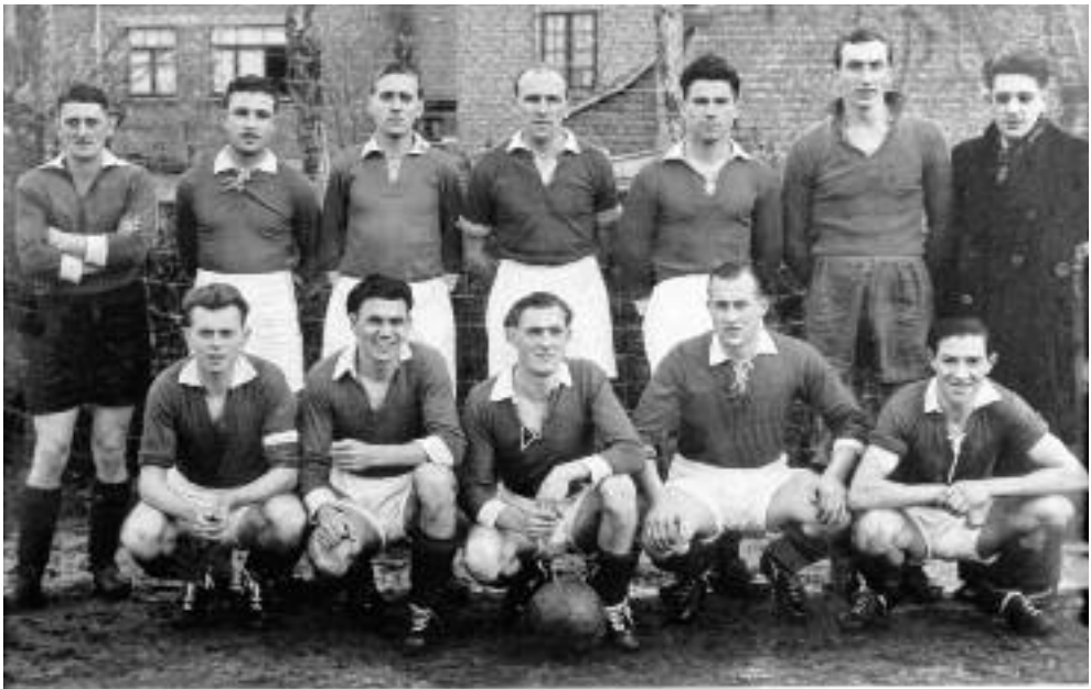
VV SPORTING SINAAI 1947-1948