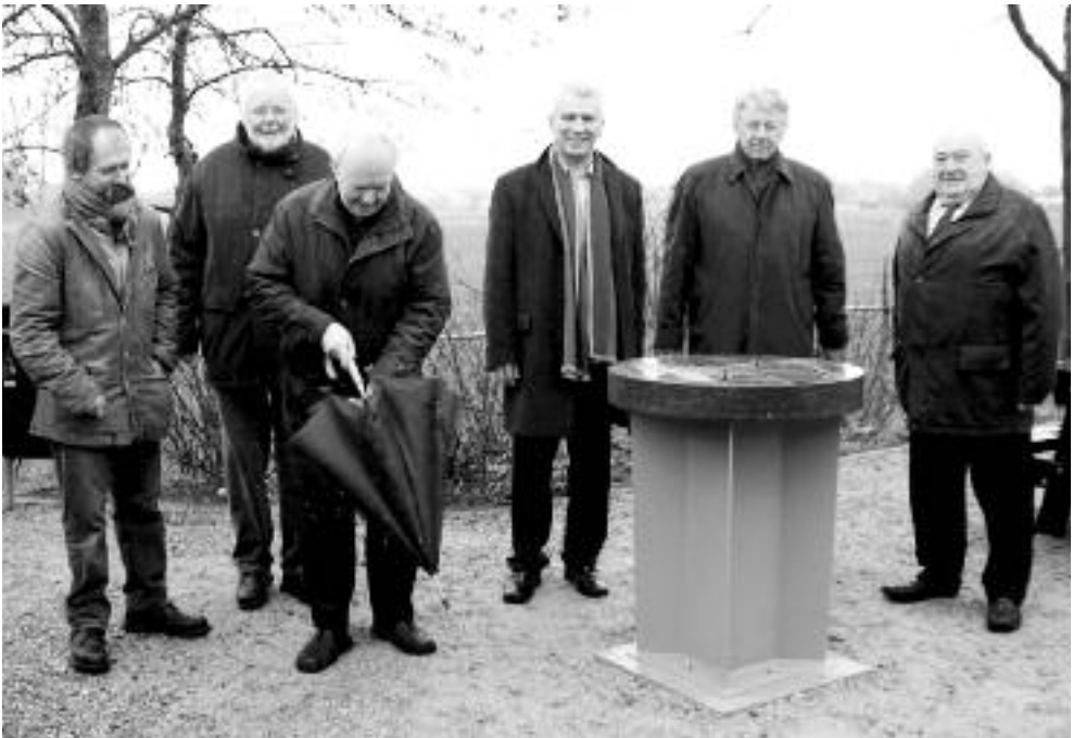
Onder een bewolkte hemel met de nodige regen en wind, werd de oriëntatietafel onthuld.