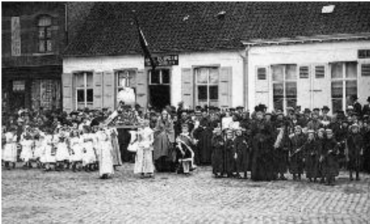
Processie der H. Kindsheid, groep 7 Weeën, Wereldbol en Zegepraal van het H. Kruis (1911)