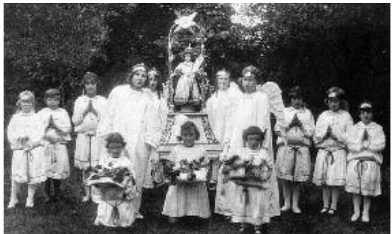
Processie der H. Kindsheid, Verheerlijking van 't Kindje Jezus (1931)