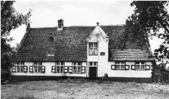
De Boudelohoeve dateert uit 1660 en werd gebouwd met het puin van de abdij.

In het jaar 1636 werd een eerste kerkje in Klein-Sinaai gebouwd, dat in 1822 werd afgebroken en in 1853 vervangen door deze huidige driebeukige kerk.