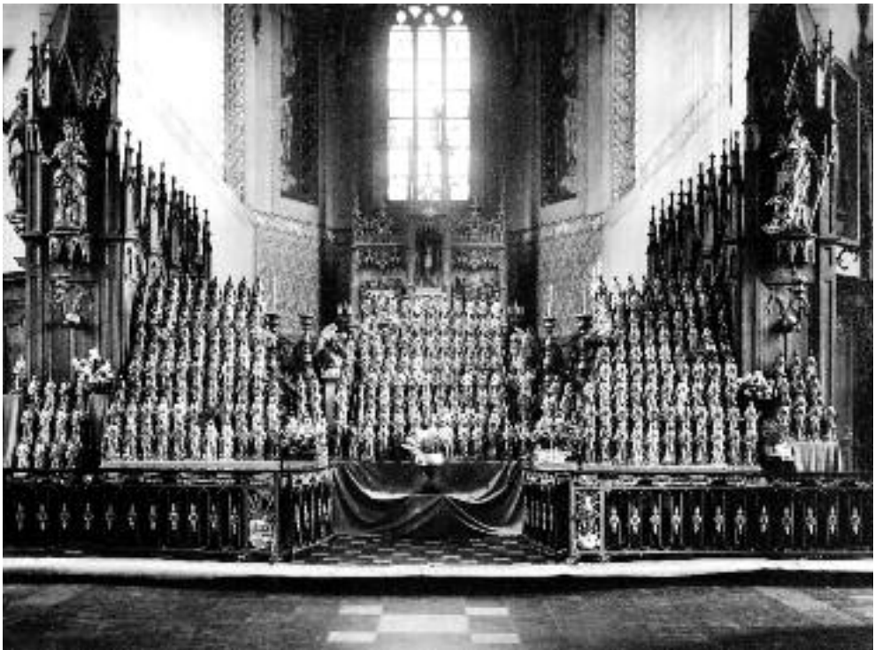
De 325 Catharinabeeldjes voor het altaar