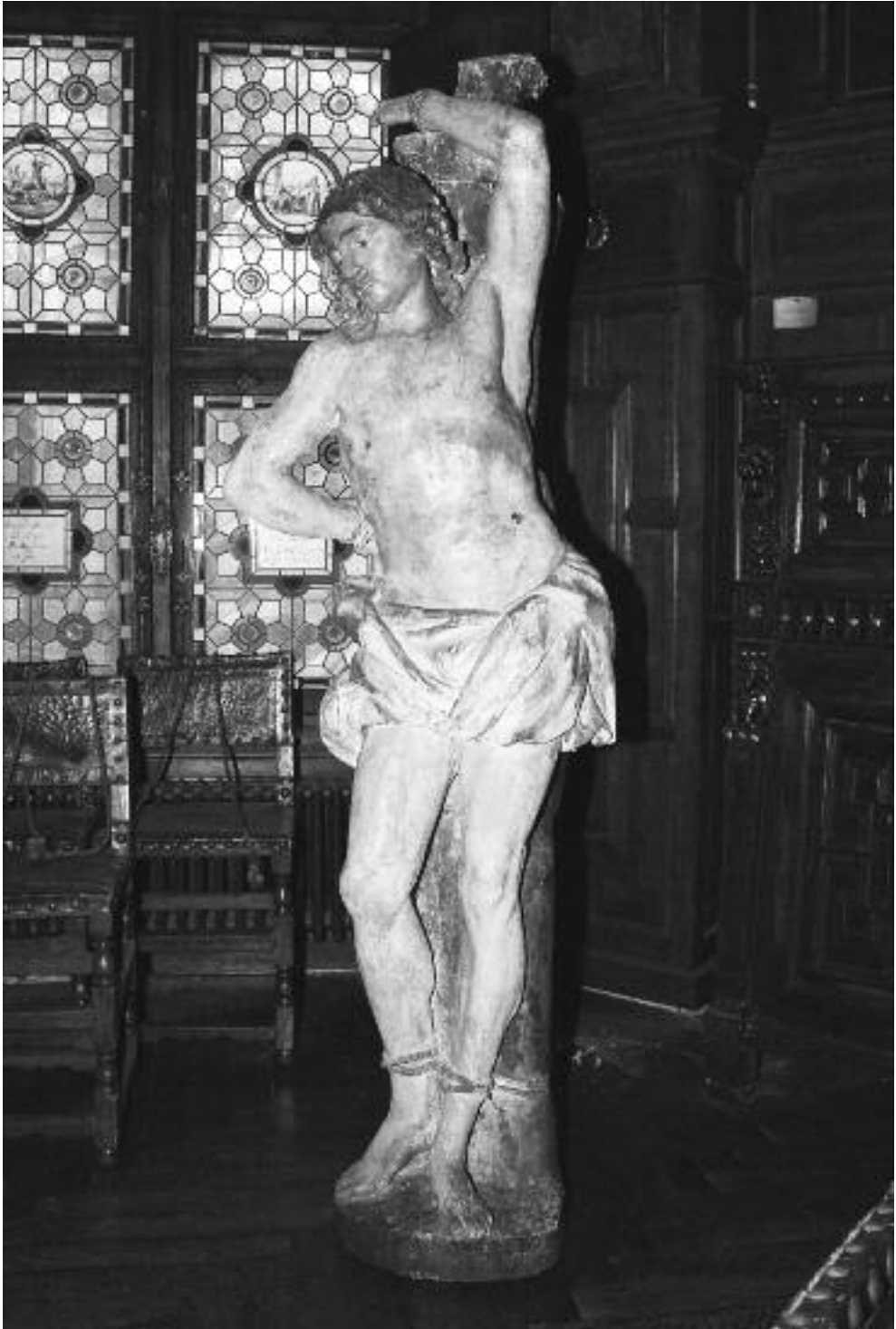
Het Sint-Sedastiaanbeeld, tijdens zijn verblijf verbleef bij het KOKW.