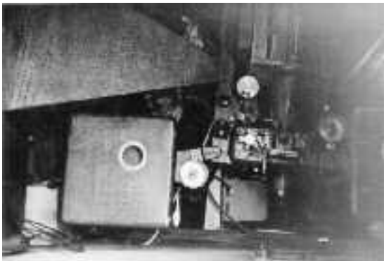
De filmprojector gebruikt in cinema "RIO"

De lichtbron om de film te projecteren werd gevormd door 2 koolstofstaven die naar elkaar toe werden gebracht en waartussen een boog werd getrokken (systeem vlamboog lassen); de afstand tussen de koolstofstaven diende regelmatig bijgesteld te worden. De lichtbron produceerde ook veel warmte, wat regelmatig aanleiding was tot breuk van de film. Enig oponthoud tijdens de projectie was geen uitzondering. De film werd door middel van aceton en lijm terug aan elkaar gekleefd.