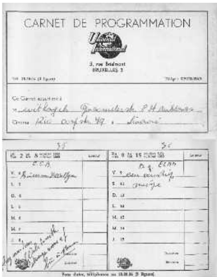
Het programmeringsboekje waarin de films werden genoteerd die de bioscoopuitbater gekozen had.

Met dank aan de families Withagels en De Bock voor het ter beschikking stellen van documenten en foto's.