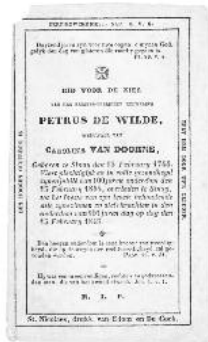
De eeuweling Petrus De Wilde, geboren te Sinaai op 13 februari 1744, overleed op 13 februari 1845