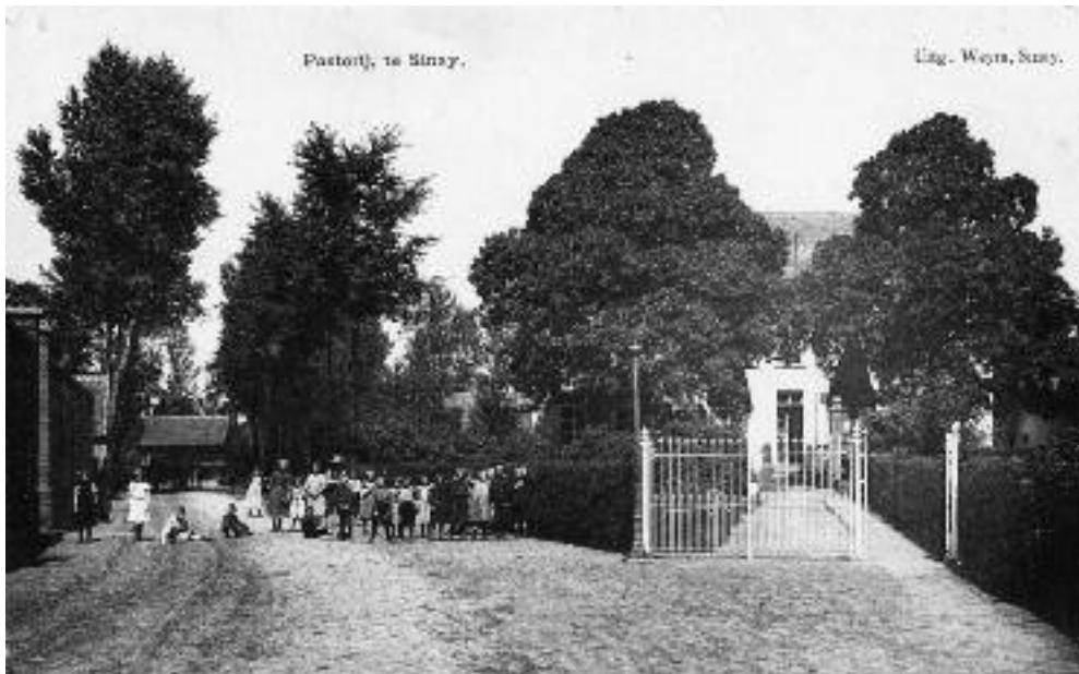
De oude pastorij ca. 1900