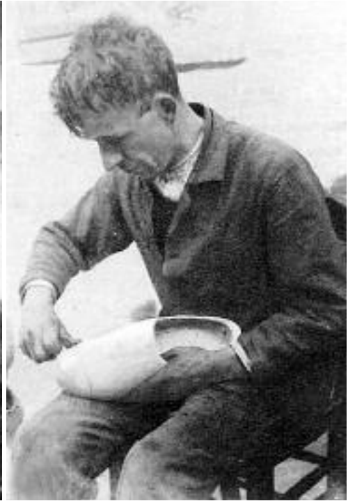
De betrekker tijdens het ritsen

Ondanks het feit dat sommige kunstig afgewerkte klompen zeer sierlijk waren, werd de blok in de jaren dertig reeds misprezen. De nijverheid leed fel onder de crisis: er werden te veel klompen gefabriceerd, de productie was te groot en de klomp werd niet meer gedragen, noch door de arbeiders, noch door de kinderen, en zeker niet meer in de zomer. Een blokmaker zei het heel typisch: