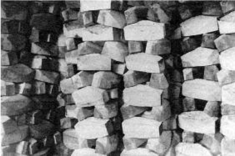
Een partij door de lintzaag gereedgezaagde stukken

Deze zaag verdeelde het hout verder in kleinere stukken en gaf ze een eerste grove blokvorm. De lintzager nummerde ze meteen en stapelde ze bij paren gereed voor de kapmachine. Deze machine kapte de stukken niet, maar draaide ze. Ze kreeg haar naam omdat ze de handenarbeid van de kapper vergemakkelijkte. De allernieuwste machines van die tijd konden de blokken met een paar tegelijk omdraaien en konden er per uur een dertigtal verwerken. Een apart rond zaagje zaagde vervolgens de hiel uit de zool. De klomp had dan vrijwel zijn definitieve vorm. De heulmachine, die er vlakbij stond boorde het binnenste in drie keer uit: eerst de hiel, dan de muil en vervolgens de tip. Deze machine werkte met het paar tegelijkertijd en kon er net zoveel uitheulen als ze van de kapmachine kreeg.