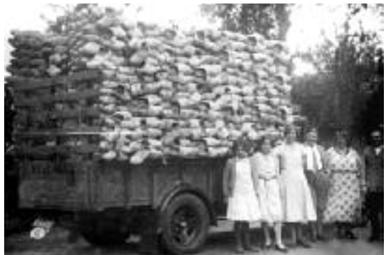
Blokken van Van Den Broeck voor Nederland

Gelukkig heeft men nog foto 's bewaard en klinkt er nog het “Wijsje van de Klompenmaker” een liedje dat ik onlangs nog hoorde, om dit beroep in ere te houden.