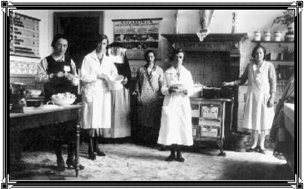
De huishoudschool bij de Zusters Maricolen

Tijdschrift van Heemkring "Den Dissel" Sinaai