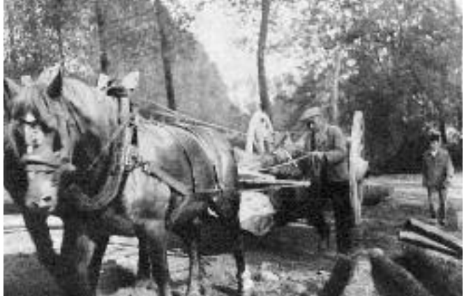
De landbouwer levert zijn bomen

De eigenaars van deze bomen verkochten ze gewoonlijk aan de plaatselijk blokmakers. In het begin van de 19 de eeuw werden al de verrichtingen van "boom tot blok" nog met de hand gedaan. Later, in de jaren dertig kwam er door de verspreiding van de drijfkracht ook te Sinaai een groot bedrijf, waar vijftien en soms man meer werkten.