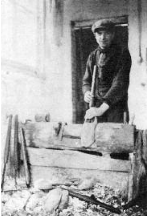
Een heuler aan zijn heulbank