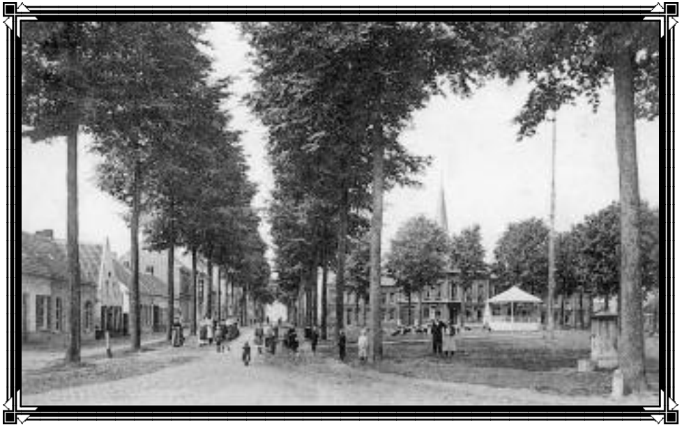
Dries Zuid ca. 1900

Tijdschrift van Heemkring "Den Dissel" Sinaai